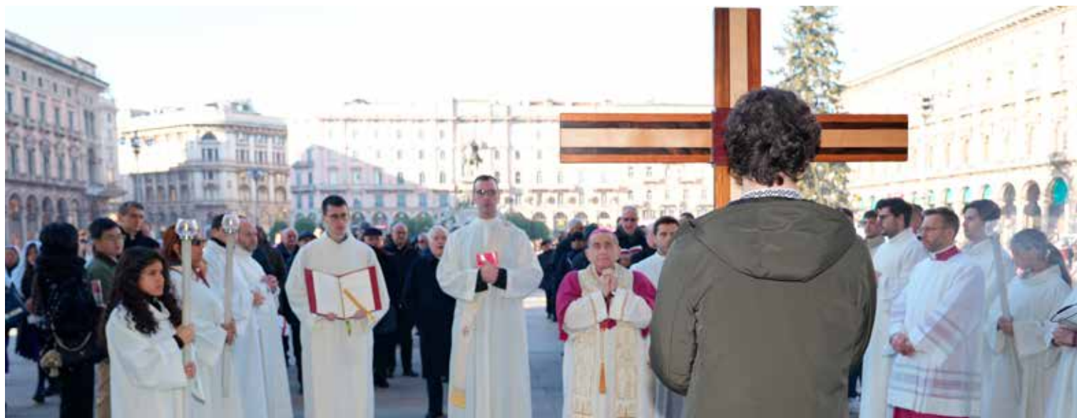
Milano, Duomo: l'Arcivescovo monsignor Mario Delpini durante la celebrazione per l'Apertura del Giubileo ordinario (29 dicembre 2024)

I gruppi parrocchiali che prevedono solo un momento di preghiera, senza unire la visita del Duomo, sono tenuti a effettuare la prenotazione esclusivamente presso la Segreteria della Chiesa Cattedrale (tel. 02.877048 - cattedrale@duomomilano.it )