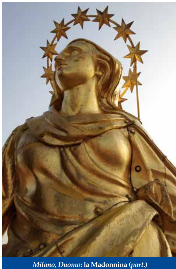
Milano, Duomo: la Madonnina (part.)

Intanto su relazione di Francesco Croce, che l'11 settembre 1770 aveva preso visione dei due modelli in terracotta del Perego (conservati oggi al Museo del Duomo), il Consiglio della Fabbrica deliberò la fusione in rame, affidandola all'orafo Giuseppe Bini – data la sopraggiunta morte del Preda – per un costo di lire 11.000, poi salito a lire 14.750 a seguito dell'aggiunta, ai piedi della statua, di