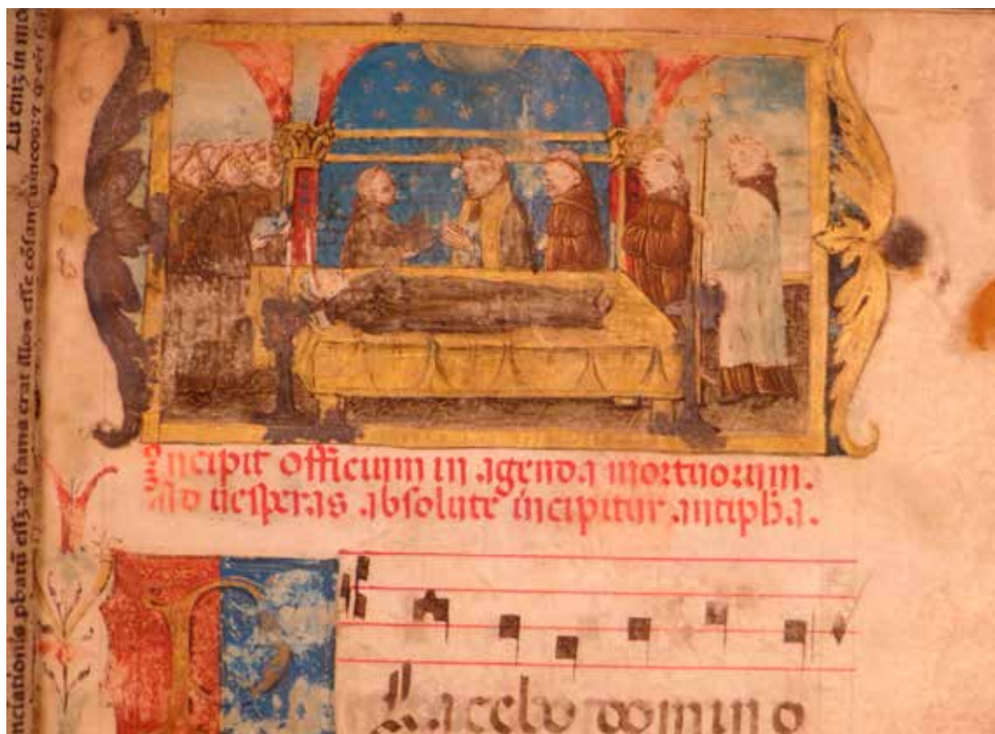
Milano, Biblioteca del Capitolo Metropolitano: Rituale monastico (miniatura, xv sec., part.)