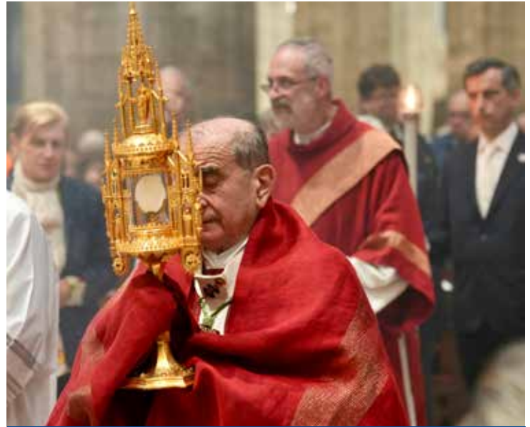
Milano, Duomo: Celebrazione diocesana del Corpus Domini, 4 giugno 2026

† monsignor Mario Delpini Arcivescovo di Milano