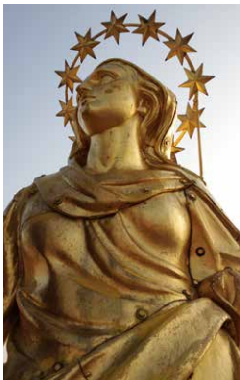
Milano, Duomo: la Madonnina (part.)