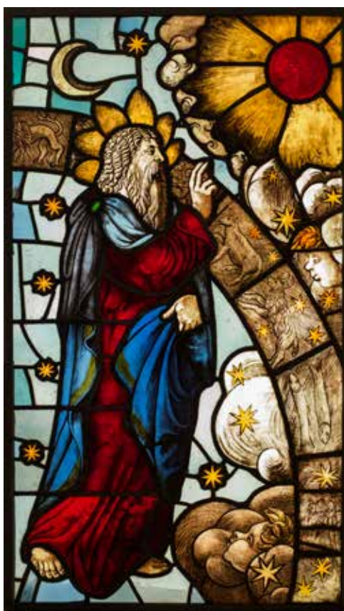
Milano, Museo del Duomo: Creazione del firmamento (vetrata, XVI sec.)

La festa del Martirio di san Giovanni (29 agosto) presenta il figlio di Zaccaria e di Elisabetta come l'ultimo dei profeti dell'antico