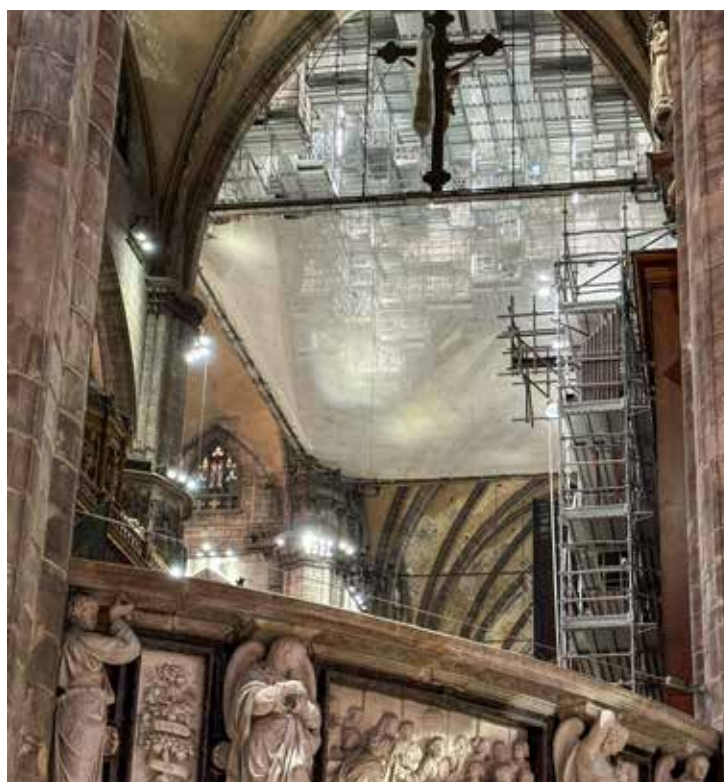
Milano, Duomo: veduta dei ponteggi del tiburio

Il marmo di Candoglia, inoltre, è stato sottoposto ad approfondite analisi diagnostiche per monitorarne lo stato di conservazione. All'interno, il restauro ha restituito leggibilità a sessanta statue mai trattate prima, progressivamente oscurate nei secoli dai fumi delle candele. Tecniche altamente selettive, come la pulitura a secco e gli impacchi chimici controllati, hanno permesso di recuperare dettagli invisibili, ampliando le conoscenze storico-artistiche sul monumento.