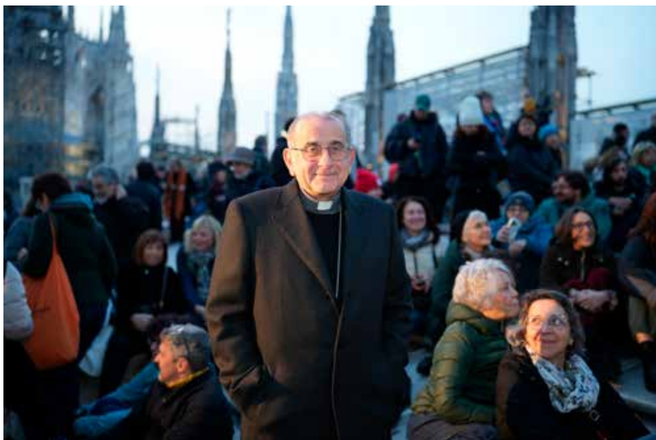
Milano, Duomo: l'Arcivescovo monsignor Mario Delpini con i fedeli sulle Terrazze, 22 marzo 2026

«I milanesi si sono abituati all'ovvio e alla frenesia, al malumore e all'indifferenza. Ci sono di quelli che trovano insopportabile la situazione. Ma che cosa si può dire? Non essere così ingenuo: non c'è da costruire un'arca per salvarsi dal diluvio. Non essere così astuto né così meschino: non c'è un deserto o un rifugio di montagna dove puoi sfuggire al contagio della peste che uccide la città. Ecco di che cosa abbiamo bisogno: un manuale per la resistenza. Resistere là in mezzo, nel cuore della città, nella complicazione della vita, nella frenesia delle giornate.